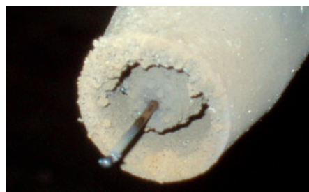
Před použitím EasyCleaner®