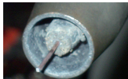
Po použití EasyCleaner®